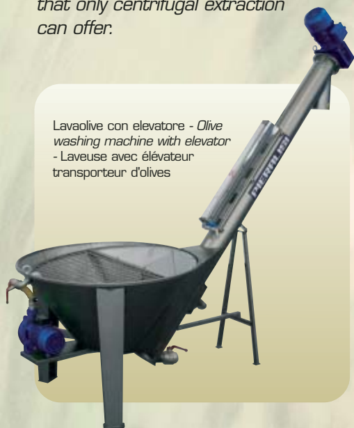
Lavaolive con elevatore - Olive washing machine with elevator - Laveuse avec élévateur transporteur d'olives

This plant is planned for the growers who process limited quantities of top quality olives, whose dream to make their own oil can now become a reality. Olive growers will be able to immediately process the olives they pick daily, thus obtaining an oil of superior quality: a home-made product with all the hygiene, perfection and faultlessness that only centrifugal extraction can offer.