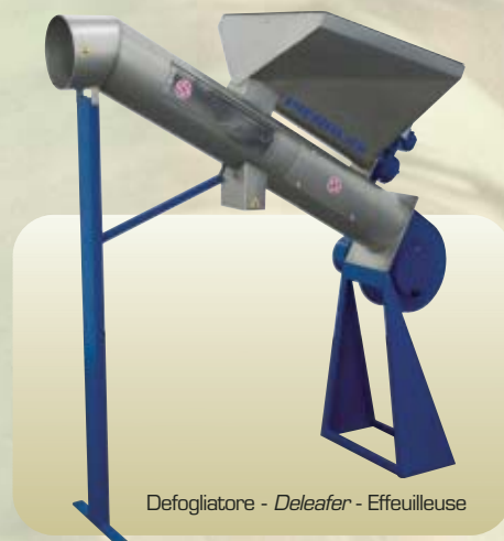
Defogliatore - Deleafer - Effeulleuse

The basic version of the FATTORIA plant consists of a hammer crusher , a FATTORIA kneading group , a mono-pump to transfer the olive paste to the centrifuge, an EFFE series centrifugal extractor with vibro-filter oil collecting tank, electric control panel and framework .