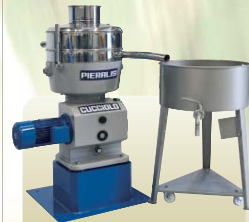
Separatore CUCCILO con contenitore di raccolta olio CUCCILO separator with oil collecting tank Séparateur CUCCILO avec bidon de récolte huile.

Tous les éléments accessoires peuvent être achetés séparément par la suite.