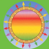
il rivestimento POLIGEN W3 ne consente un rilascio controllato (per circa 3 mesi).