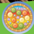
si crea una soluzione di elementi nutritivi